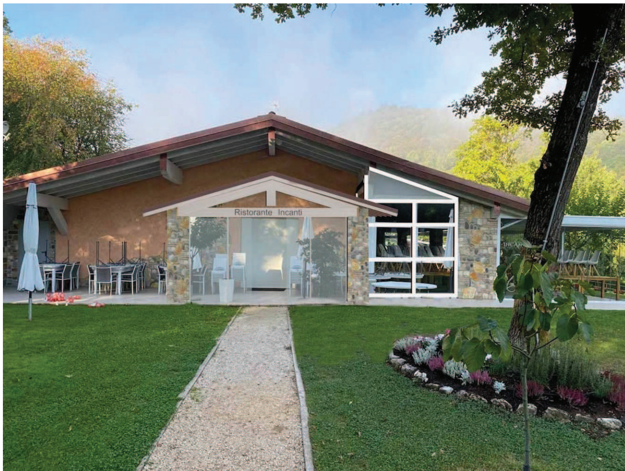
IMMAGINE FOTOMONTAGGIO – INSERIMENTO BUSSOLA E VETRATA CHIUSURA PORZIONE PORTICO

CHIUSURA PORZIONE PORTICO ESISTENTE - REALIZZAZIONE BUSSOLA INGRESSO